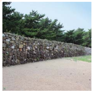
松原 生の松原や今津長浜松原など があり、黒松(クロマツ)が 植えられています。