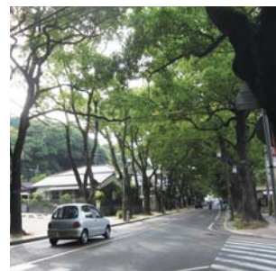
街路樹 香椎参道(クスノキ)やケ ヤキ通り(ケヤキ)など、 緑のトンネルが印象的です。