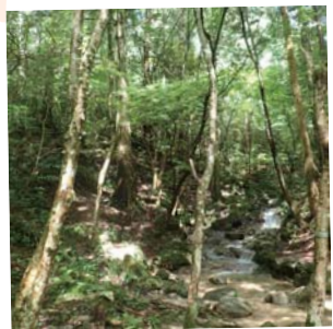
山や森 油山や鴻巣山など、福岡市 はたくさん山や森に囲ま れています。