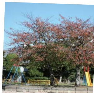
身近な公園 私たちの暮らしの中でもっ ともみじかな『みどり』の ひとつです。