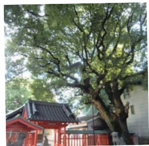
お寺や神社 大きな樹木を見ることが できます。