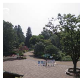
植物園 福岡市で一番多くの樹木を 見ることができます。