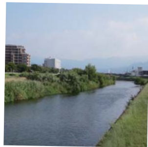
川辺 まちなかや山とはちがう種 類の樹木や野草などを見る ことができます。