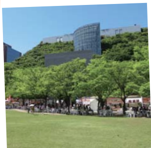
屋上・壁面緑化 建物の屋上や壁に樹木など を植える珍しい『みどり』 もあります。