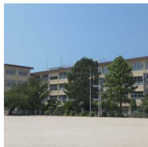
学校 樹木や花だん、緑のカーテ ンなど、さまざまな『みど り』があります。