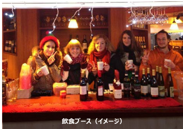
飲食ブース（イメージ）