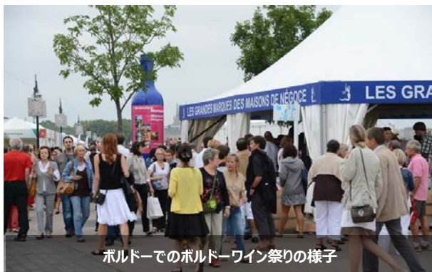
ボルドーでのボルドーワイン祭りの様子