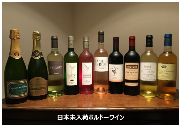
日本未入荷ボルドーワイン