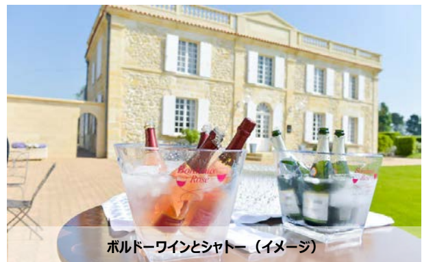
ボルドーワインとシャトー（イメージ）