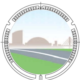
<デザイン後(イメージ)>