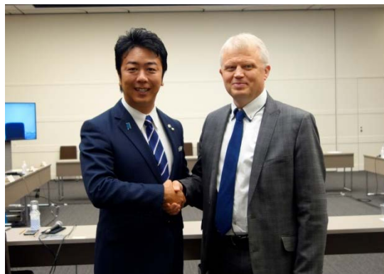
スタートアップ法人減税（国税）第一号に指定されたサウレテクノロジー株式会社