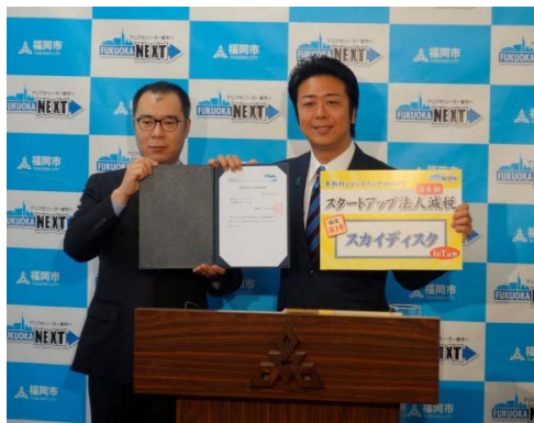
スタートアップ法人減税（市税）第一号に指定された株式会社スカイディスク