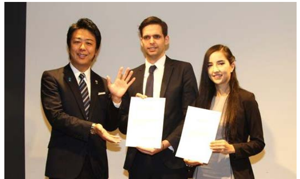
H28.1月には創業活動確認証明書を初交付