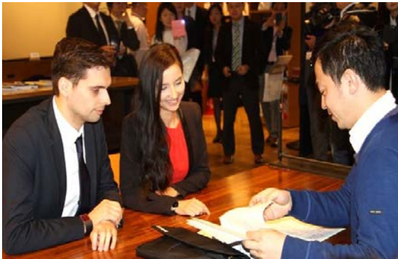
受付開始日にフランス人が申請

外国人の創業活動を促進するため、在留資格（経営・管理）の取得要件を満たす見込みのある外国人の創業活動を特例的に認める『 スタートアップビザ 』の受付を、平成27年12月9日に開始しました。