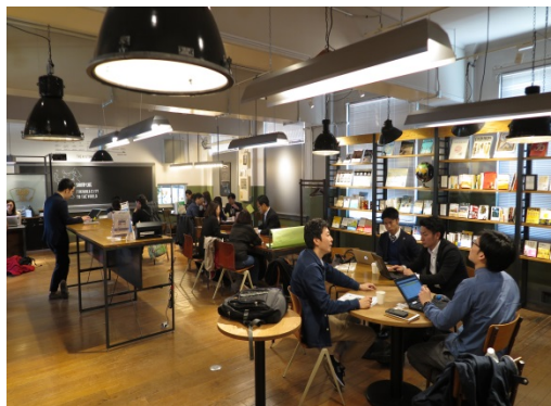
気軽に立ち寄れる、雰囲気の良いカフェ♪

「スタートアップしたい人」と「スタートアップを応援したい人」の交流の場として平成26年10月11日にオープンした福岡市の スタートアップカフェ と同年11月29日にカフェに併設した「 福岡市雇用労働相談センター 」(FECC)。 FUKUOKA growth next のオープンに伴い、平成29年4月12日に移転しています。