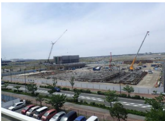
平成30年5月（照葉小中学校からの写真）