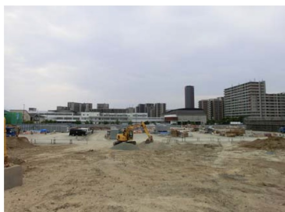
平成30年5月（北方向からの写真）