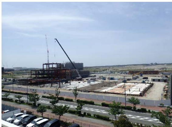
平成30年6月（照葉小中学校からの写真）