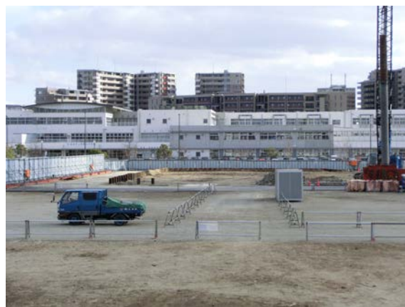
平成30年1月（北方向からの写真）