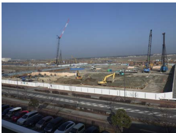
平成30年2月