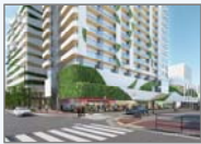
那の津通り側外観イメージ