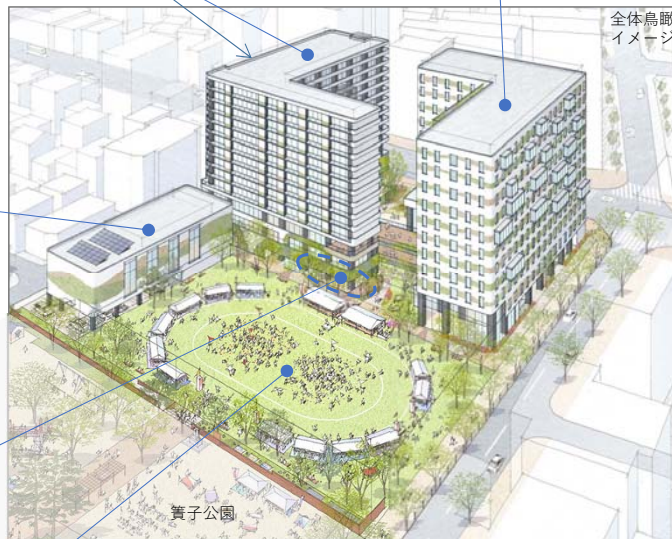
全体鳥瞰イメージ