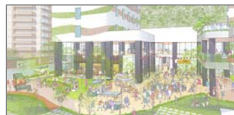
中庭での マルシェ イメージ

他にも、花壇・植栽やベンチの設置 多彩なイベント実施、商店街との連携 など、地域の魅力向上に取り組みます！