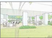
すのこハウスイメージ