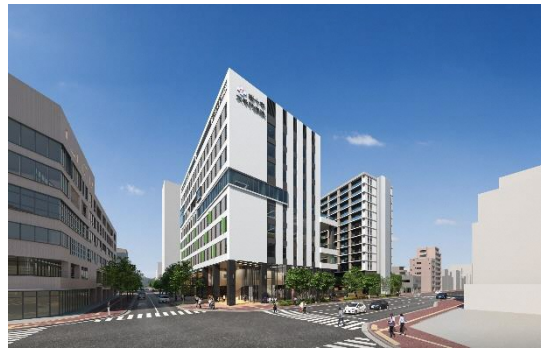
敷地北東（那の津通り）側から

桜十字大手門病院は、桜十字グループの医療法人愛光会が運営する慢性期・回復期病床 100 床の他、デイケア・外来機能を備えた病院です。病院内には、見晴らしが良く開放感のあるリハビリ空間を設けると同時に、中庭にもリハビリが可能な歩行空間を設ける等、幅広い世代がリハビリに専念できる様々な工夫を凝らしています。また、健康をテーマにしたイベントを開催するなど、予防医療への取組みにも力を入れています。