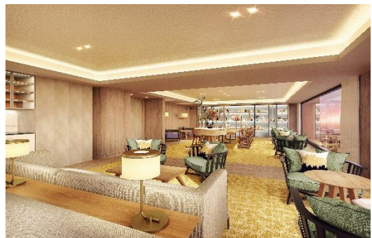
13 階スカイラウンジ

SJR 大手門は、JR九州シニアライフサポート株式会社が運営する自立の方向けの居室 168 室を備える有料老人ホームです。ダイニング・スカイラウンジ・大浴場等多彩な共用空間を備えます。大濠公園に近く、天神・博多までもアクセスが良い立地で、アクティブにお過ごしいただけます。また、全室に最新の IoT ヘルスケアサービスを導入しており、安心して暮らすことができます。