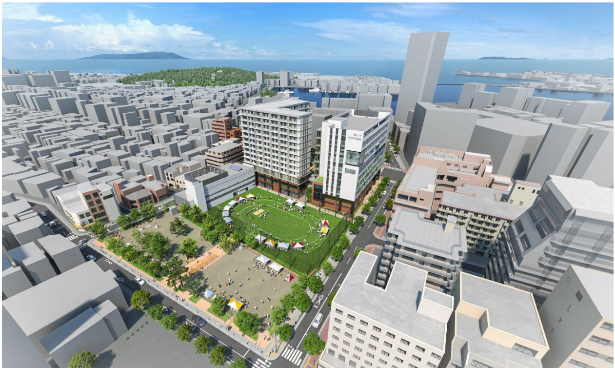
全体鳥瞰パース 敷地南（簗子公園）側から

簗子小学校は、地域におけるこれまでの地域活動や災害時の避難場所としての役割を担う場所でありました。本事業では事業方針を「地域を支える場所、再び。- Re すのこ -」とし、地域の賑わいや魅力づくり、災害対策、安全安心の拠点とすべく、病院、高齢者施設、芝生広場、体育館等からなる開発を進めてまいります。