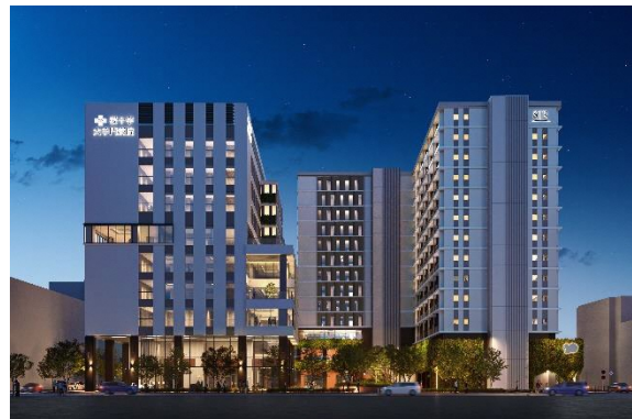
敷地北（那の津通り）側から（夜景）