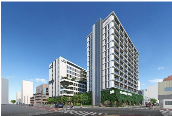
敷地北西（那の津通り）側から