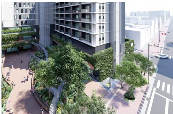
敷地北（那の津通り）側から