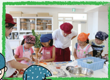
ランチにチャレンジ