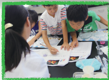
サイエンスにチャレンジ