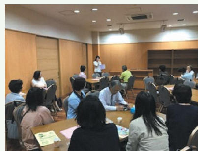
「おさカフェ」の会場としてホールを奇数月に開放