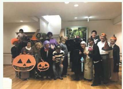
ハロウィンパーティ