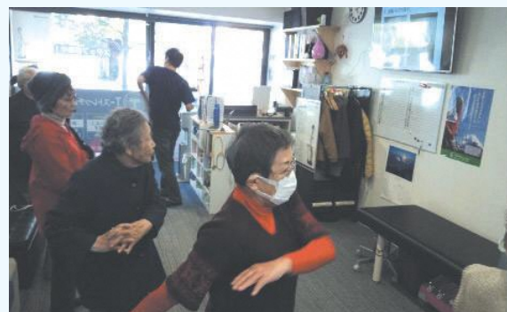
具体的な運動をアドバイスする健康講座