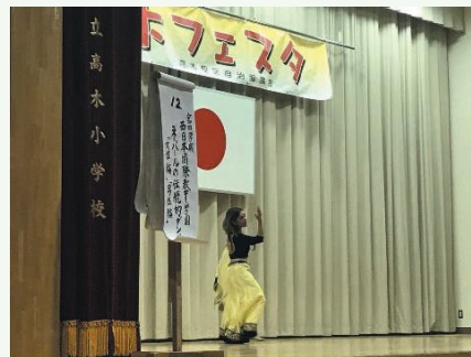
ステージでのダンス