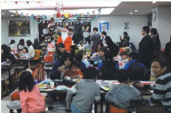
12月にはサンタクロースが登場