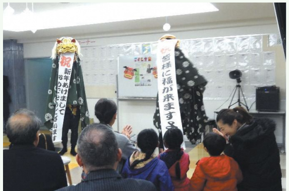
1月には獅子舞が登場