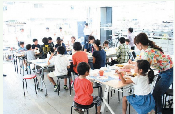
8月には屋外でバーベキュー

毎月第1・第3金曜日に開催され、学校の職員や外国人留学生が運営しており、季節や行事、「〇〇の日」にちなんだ食事メニューを提供しています。また、食事だけでなく地域のボランティアによるマジックショーや演奏会など、毎回様々なイベントを行い、こどもたちが楽しめる場所となっています。