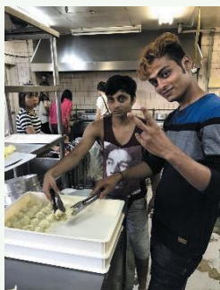
ベトナム・ネパールの料理を販売

高木小学校の体育館ステージでネパール出身の学生たちが母国のダンスを披露。会場ではベトナム出身の学生たちが中心となってブースを出店し、母国の料理を販売しました。すべての商品が完売するほどの好評ぶりで、収益金はすべて九州北部豪雨の義援金にあてられました。