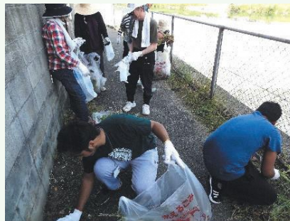
ラブアースに参加する留学生

平成29年5月に高木寮の留学生15名が福岡市の市民・企業・行政が協力し、海岸や河川・公園などの一斉清掃を行う環境美化活動「ラブアース・クリーンアップ」に参加し、高木地区の清掃活動を行いました。また、平成29年7月には国際貢献専門大学の留学生が南区事業「公園維持管理機材レンタル事業」を活用して大橋東公園の除草作業を行いました。