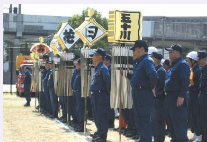
ポンプ操法大会の様子

当日は、操法大会に加えて、はしご車試乗体験や消防服試着体験、南警察署のパトカー・白バイ展示などがあり、来場者からも大変喜ばれるイベントとなりました。