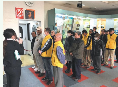
防災研修では多くの住民の送迎を担当