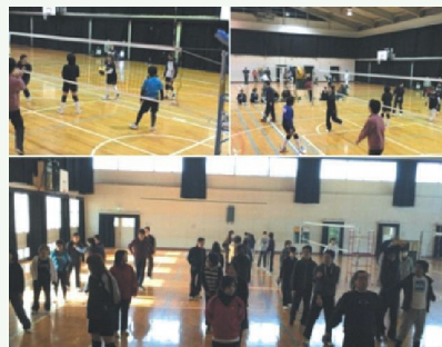
バレーボール大会