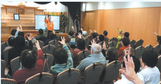
イベント会場の様子

平成30年1月、「メモリードホール南福岡」を会場に、地域のみなさまを対象とした健康づくりイベントを開催しました。湿布の貼り方講座、けが予防のためのテーピング講座、薬剤師や栄養士への健康相談、骨密度測定など、暮らしに役立つ内容です。参加者からも好評で、今後も取組みを継続する予定です。