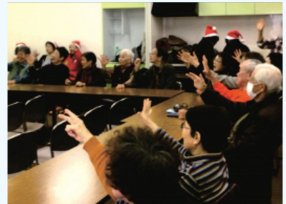
じゃんけんゲームで脳を活性化

高齢者を対象に公民館などで開催されている健康づくりや介護予防の活動に、社員が講師として参加し、手軽にできる体操の紹介や薬剤師による薬の使い方講座、健康測定会などを実施しています。自分で自分の健康を管理する「セルフメディケーション」を実現するため、地域のみなさまの健康づくりを応援しています。