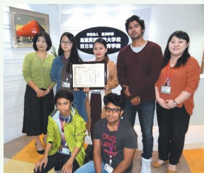
感謝状と記念撮影

近隣に立地する福岡市立宮竹中学校が、毎年11月に開催している「国際交流会」に西日本国際教育学院の留学生が参加するなど、宮竹中学校の生徒との交流を10年にわたって行っています。これまでの国際理解教育活動への貢献に対して平成29年10月に宮竹中学校より感謝状が贈呈されました。