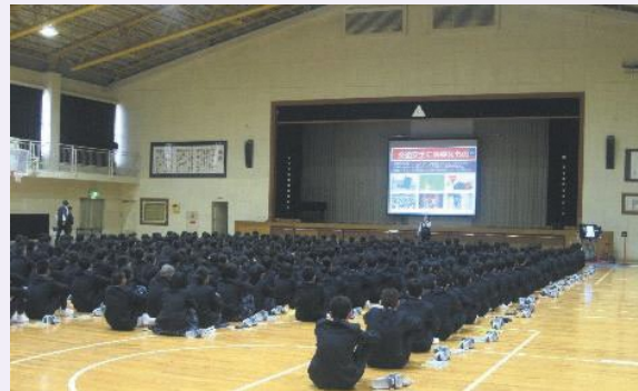
交通安全教室の様子