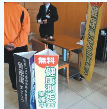
無料健康測定会で骨密度チェック