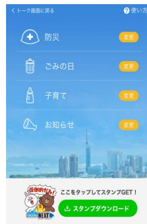
選択メニュー画面

※なお、平成29年10月24日までを実証実験の実施期間とし、実施結果を検証し、事業効果等を踏まえて、事業継続の可否を判断します。