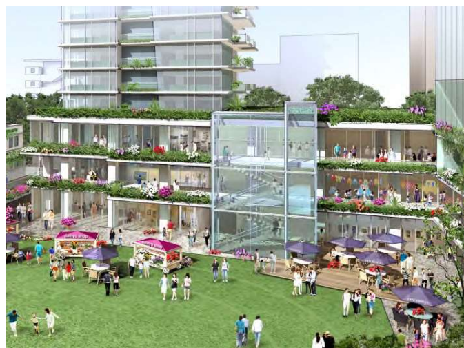
↑ 広場東側からコミュニティ棟を望む