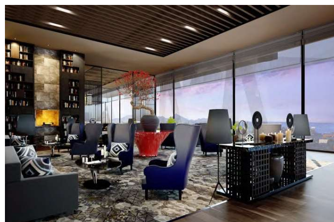
↑ ホテル「THE RITZ-CARLTON」 プライベートラウンジ（18階）