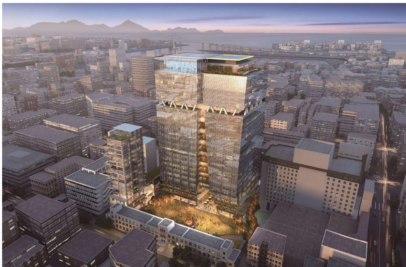
↑南東上空より全景を望む