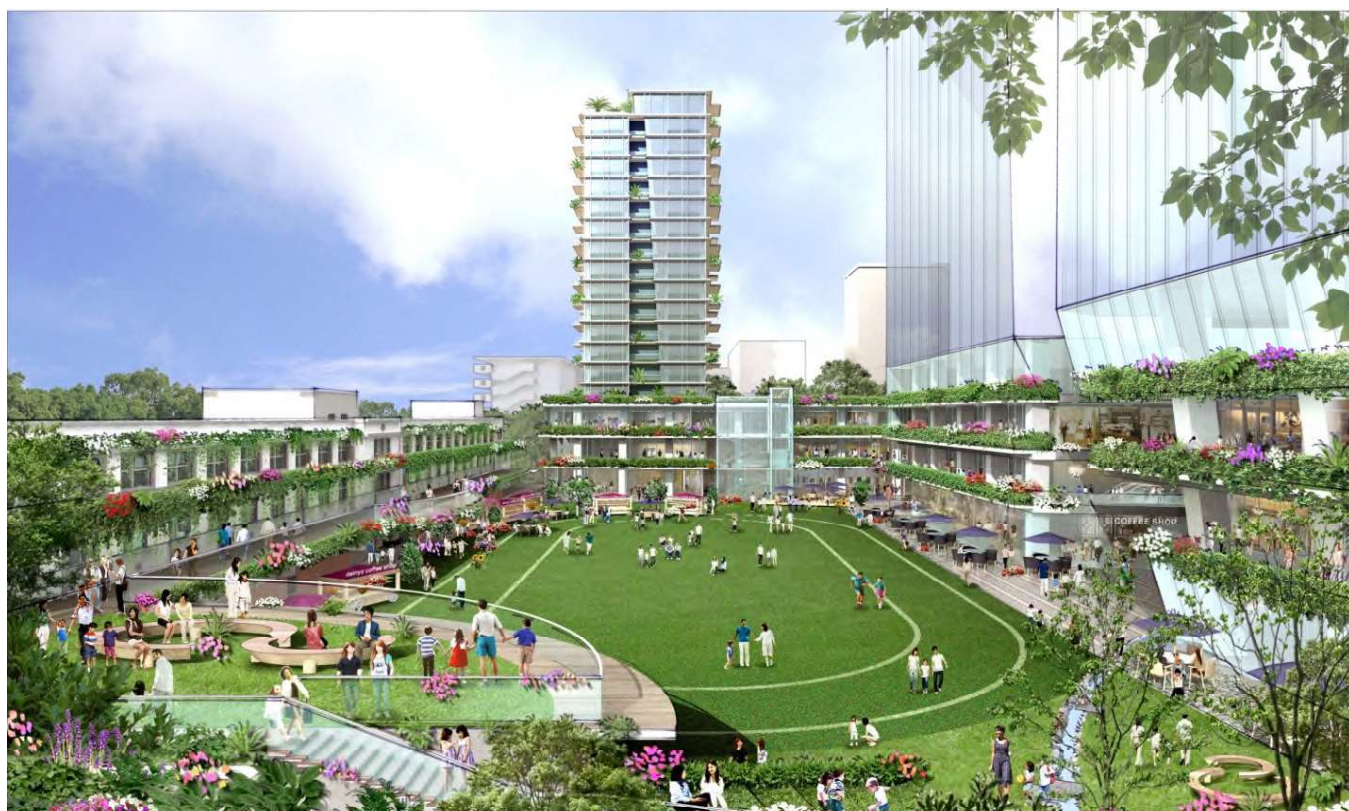
↑広場東側から（既出）