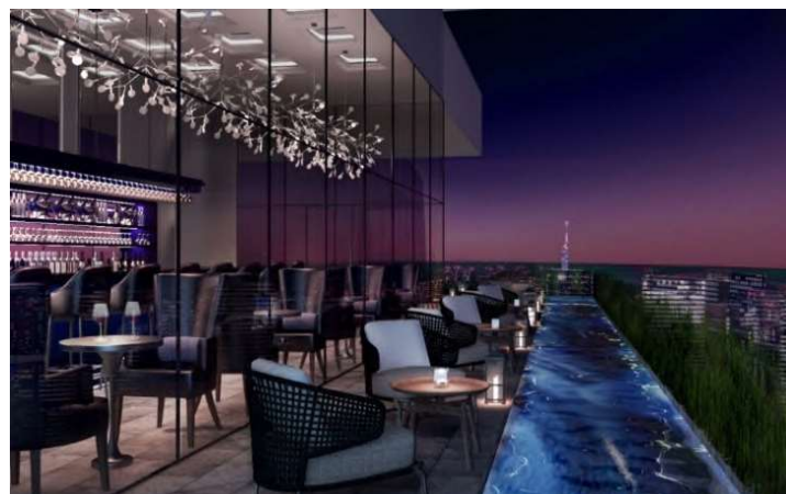
↑ ホテル「THE RITZ-CARLTON」 ルーフトップバー（24階）