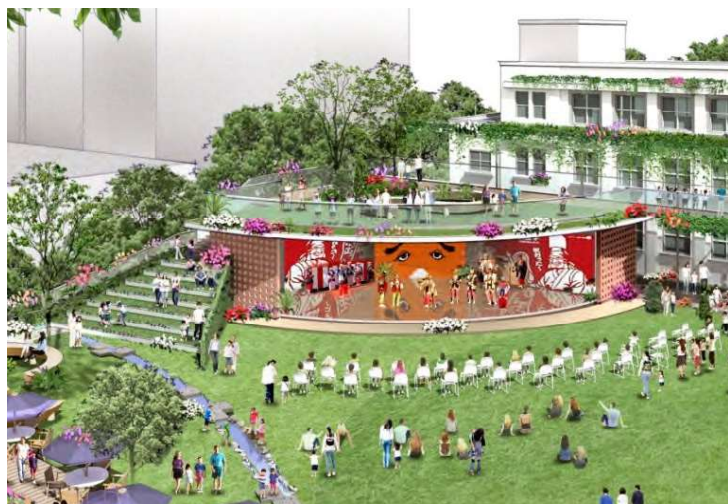
↑ 広場西側からイベントホールを望む