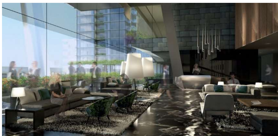
↑ オフィス スカイロビー（3階）