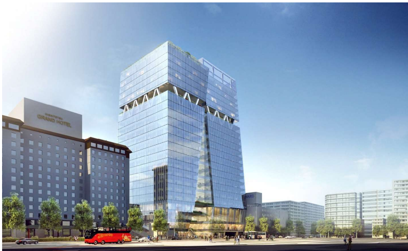
↑ 明治通り東側より全景を望む（既出）