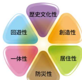
【旧大名小学校跡地に備える要素】