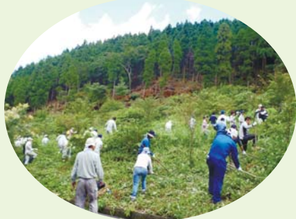
200海里の森づくりでの下草刈り

福岡市は大きな河川がないなど、地理的に水資源に恵まれず、水源の多くを市域外に頼っています。その水を育てているのが森林です。