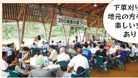
200海里の森づくり交流会

【応募方法】 参加したい事業名、参加者全員の住所・氏名・年齢・代表者の電話番号を記入し、はがき・FAX・Eメールのいずれかで水道局流域連携課までお申込ください。