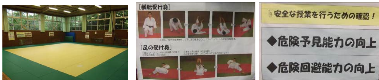
図2 武道場全体と武道場掲示物