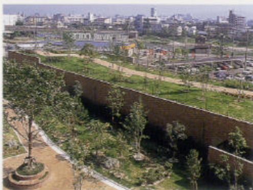
パロス・リバーコート博多地下駐車場上部公園

シヨンの「パロス・リバーコート博多善念館」が完成し、分譲を開始している。窓を開ければ川と緑が目の前に広がり、自然の風が感じられる。また、敷地内は駐車場を地下に設け、地表を公園化。子どもたちが車を気にせず遊べる等、安全や環境にも配慮されている。今後、式番館から五番館まで次々に分譲を行う予定だ。一方の住宅・都市整備公団は、東京の隅田川流域の大規模再開発において類似のプロジェクトの経験がある。川沿いの工業地帯が産業構造の変換で住宅を中心とした都市計画に組み込まれるケースは、河川と住民の豊かな関係の復権を打ち出している点も合わせ「リバーシテイオ那珂川」との重なりも少なくない。美野島地区では既に196戸の賃貸住宅「アーベイン美野島」を供給済みである。清水地区では、平成15年までに約500戸の賃貸住宅「アーベインリビエ清水」の供給を予定しており、11年12月に1棟目が完成する。