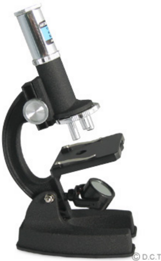
せいぶつけんびきょう 生物顕微鏡