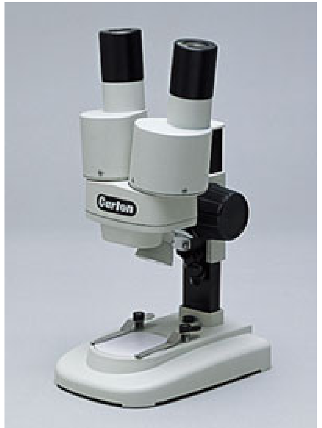
じつたいけんびきょう 実体顕微鏡