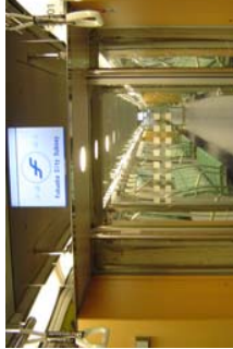
LCD式車内案内表示器