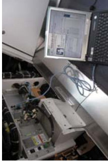
コンテンツ編集用PC