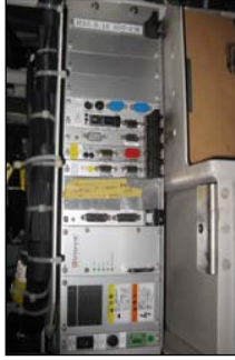
運行情報配信用サーバ装置