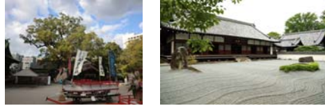
福岡の財産である歴史資源の例 住吉神社 承天寺