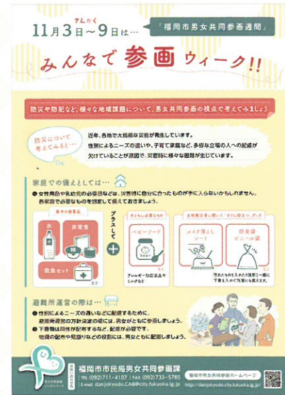
(平成30年度 みんなで参画ウィークチラシ)