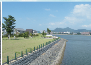
身近に自然とふれあえる場