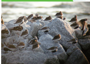
渡り鳥が利用する場