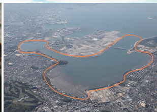
エコパークゾーンの 豊かな自然を実感できる場