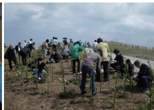
多様な主体が関わる場

人と自然との共生を象徴する空間づくりを目指し、本公園の「基本計画(整備プラン)」素案をとりまとめました。