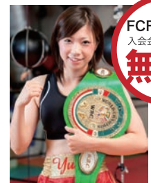
黒木優子プロ(WBC世界女子アトム級3位)