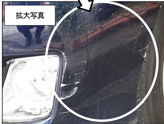
市側の庁用自動車