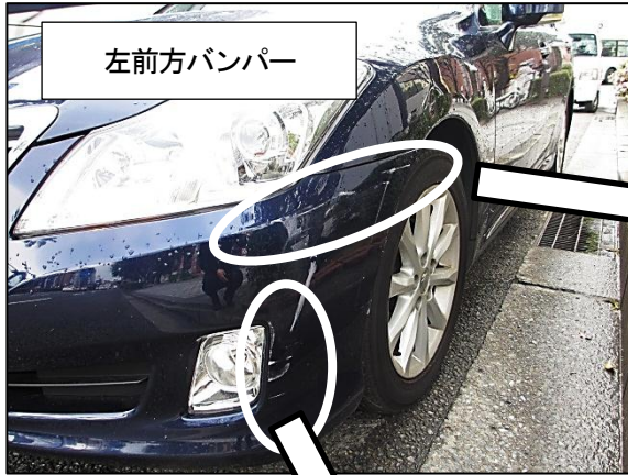
相手方の普通乗用車