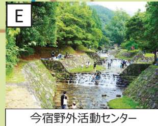
今宿野外活動センター