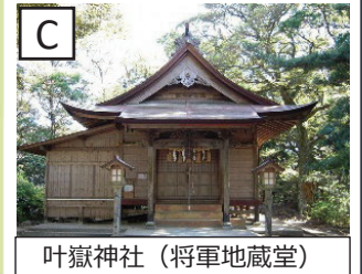
叶嶽神社 (将軍地蔵堂)