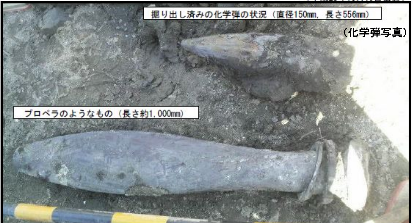
プロベラのようなもの (長さ約1,000mm)