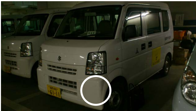
⑤破損（修）箇所（左前タイヤハウス）