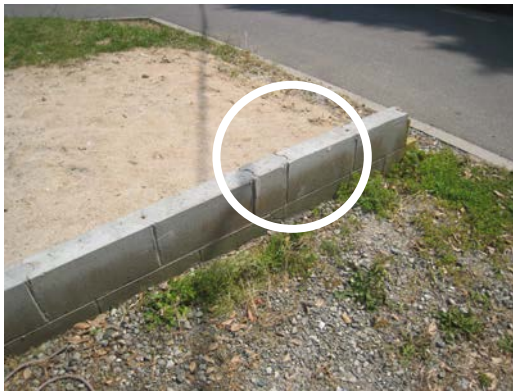
②ブロック破損状況