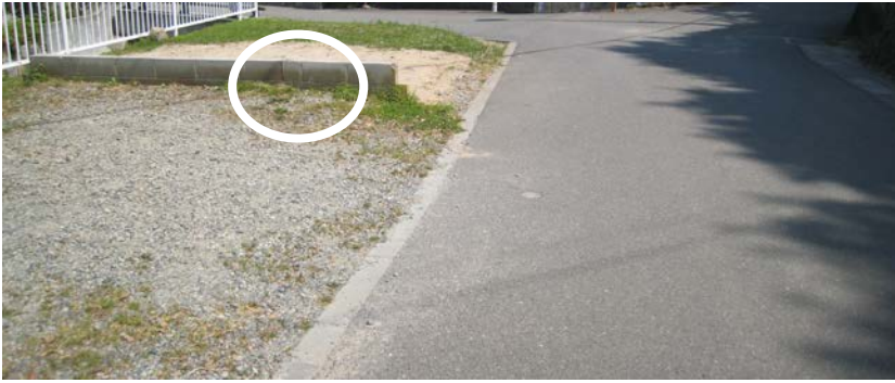
②ブロック破損状況