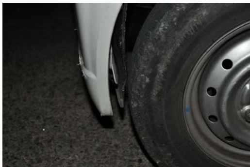
⑤ 破損（修）箇所（左前タイヤハウス）