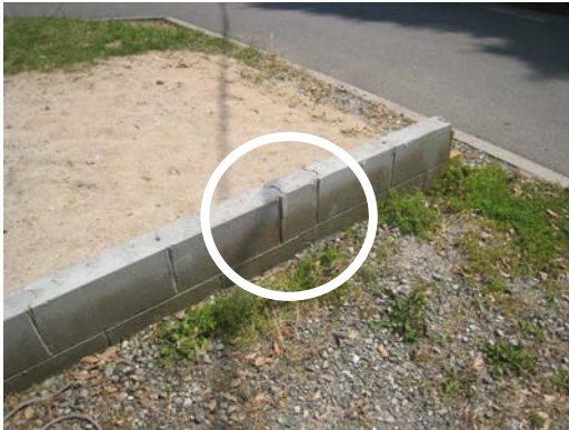
② ブロック破損状況