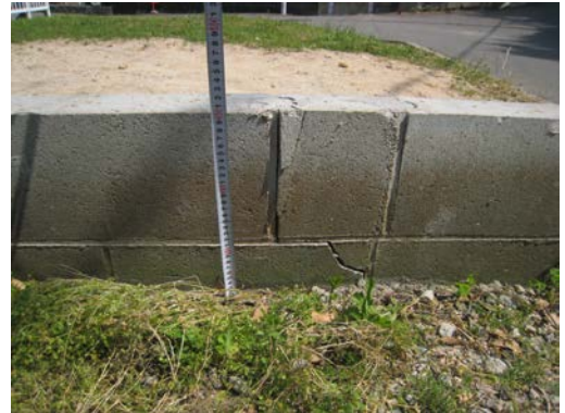
③ ブロック破損状況