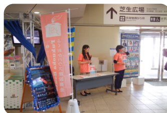
イベントでの募金活動