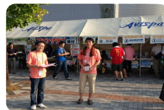
レベルファイブスタジアム での募金活動