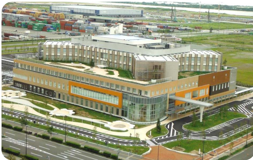
建設現場全景（アイランドタワー15Fより平成26年8月撮影）