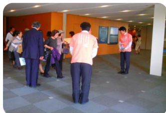
会議場での募金活動