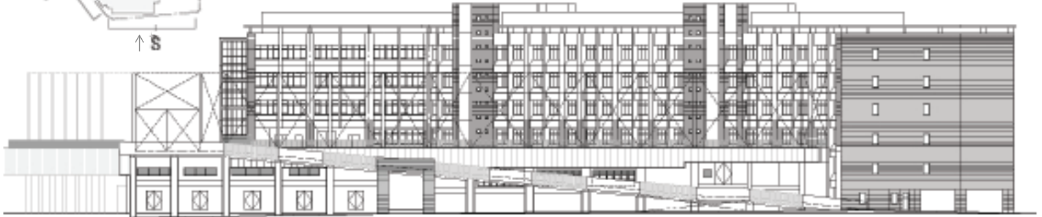
N（運動場棟+校舎棟 北側）立面図 S=1/700