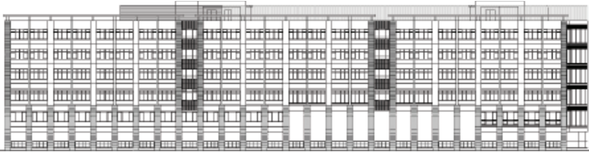
S W（校舎棟南西側）立面図 S=1/700