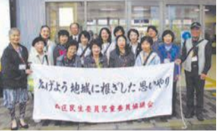
民生委員・児童委員の皆さん

民生委員・児童委員は、地域から推薦され、厚生労働大臣の委嘱を受けたボランティアです。区内では約300人が活動し、福祉や子育てなどの支援を行っています。