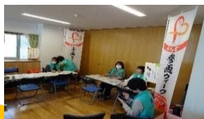
男女共同参画コーナー

公民館前の駐車場では、模擬店ができ「焼きそば」等の販売が行われ即完売でした。また各種の体験コーナーでは、多数の人々が笑顔で参加していました。