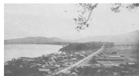
玄洋校区の1940年ごろ