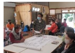
防災訓練をする西一町内会のみなさん