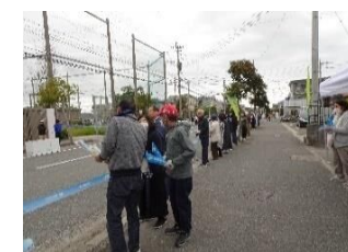
(自治協本部前の応援)