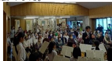
(玄洋中吹奏楽部の演奏)

公民館前の駐車場では、模擬店ができ「焼きそば」等の販売が行われ即完売でした。また各種の体験コーナーでは、多数の人々が笑顔で参加していました。