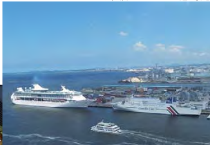
外航クルーズ船寄港