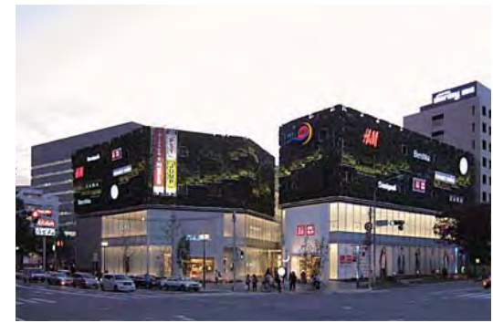
キャナルシティ・イーストビル