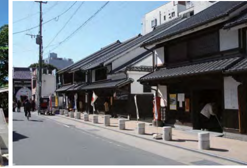
博多町家ふるさと館