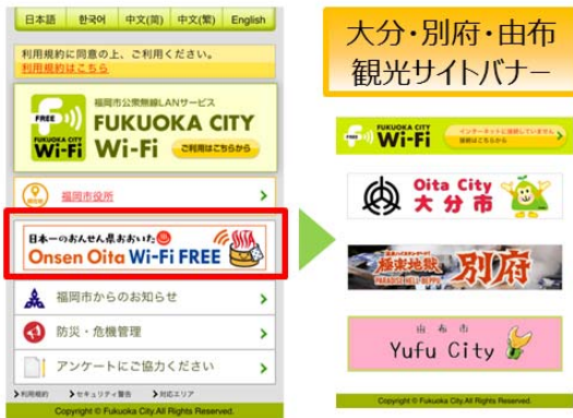
Fukuoka City Wi-Fi ポータルサイト