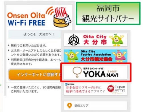
Onsen Oita Wi-Fi City ポータルサイト