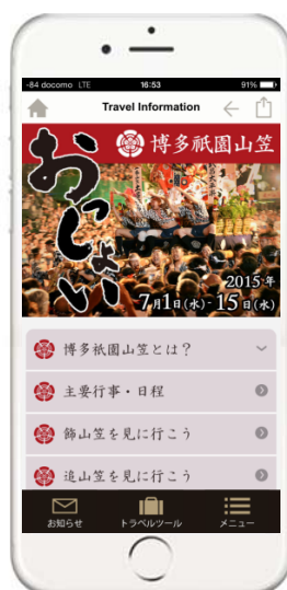
カスタマイズ画面