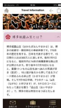
博多祇園山笠の説明