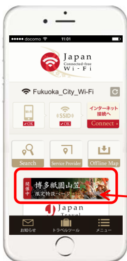
Japan Wi-Fi 通常トップ画面