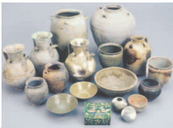
中国産陶磁器(上写真)のほか、朝鮮・イスラム系陶器やヘルシャ系のガラス器など、海と陸の交易ルートを経た遺物が数多く出土しており、当時国際的な交易の拠点だったことを物語っている。国内で初めて古代(奈良時代)便所跡を発見。トイレトペーパー代わりに使用されていた箸木(ちゅうぎ・右写真)という木片が多数見つかった。