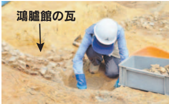
鴻臚館の瓦 平成18年度から、平和台球場跡地の北半分を対象とした第5期発掘調査が行われている。現在、北館の東門につながる通路部分の調査を進めている(上写真)。