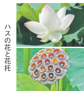
ハスの花と花托