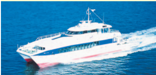
海風に当たりながら博多湾を探検します

期8月23日(木)午前9時に中央区役所玄関前集合。午後4時解散予定。対区内に住む小・中学生とその保護者定45人料無料(昼食と飲み物は各自持参)申はがきか、メール(kikaku.CWO@city.fukuoka.lg.jp)に施設見学会参加希望と明記の上、参加者全員(5人まで申し込み可)の氏名(ふりがな)、年齢と代表者の郵便番号と住所、電話番号を書いて7月27日(必着)までに区企画課(〒810-8622住所不要 ☎718-1013 F716-0307)へ。応募多数のときは抽選。小雨決行。