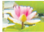
桃色と黄色のスイレンの花(写真上)を見る

舞鶴公園さんぽ道 第14回 「スイレンとハス」 舞鶴公園では、水生植物のスイレンとハスの見頃を迎えています。フランスの画家クロード・モネの描いた「睡蓮」は世界的に有名です。4号濠では黄色、6号濠では桃色と黄色のスイレンの花(写真上)を見ることが出来ます。また、1号、2号、3号および6号濠ではハスの花が咲き始め、9月ごろまでご覧いただけます。