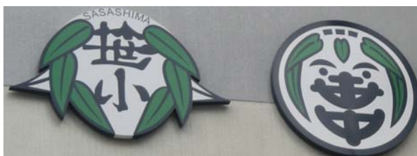
笹島小学校・笹島中学校