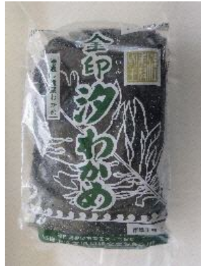
志賀島金印汐わかめ