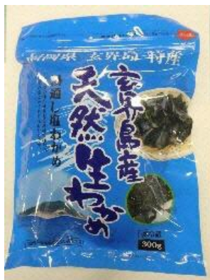
玄界島天然生わかめ