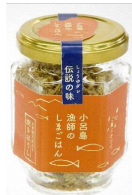
小呂島漁師のしまごはん （ヤズフレーク）