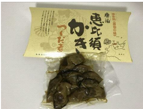
唐泊恵比須かき つくだ煮