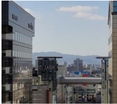
黄砂の飛来してない日