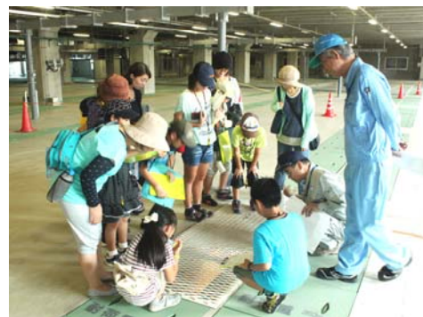
水処理センターで下水道処理の仕組みを見学