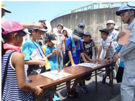
水処理センターでの水質実験