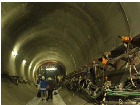
下水道の工事現場見学