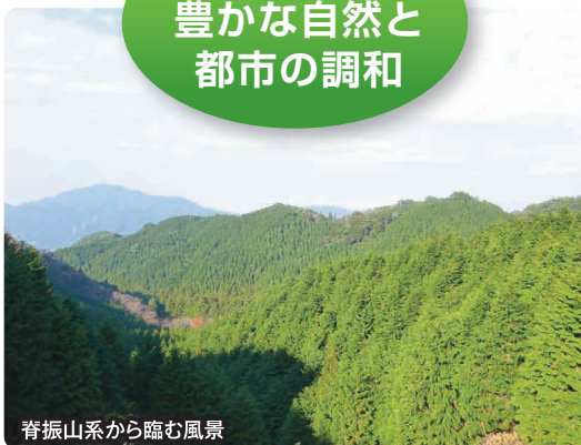
脊振山系から臨む風景