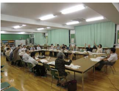
開校準備委員会の開催風景

校章・校歌については、十一月に住吉小学校で開催予定の開校記念式典で披露できるように作成を進めていきます。