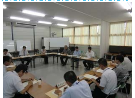
交通安全部会の開催風景