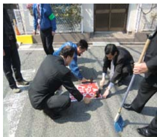
注意喚起標示の整備風景