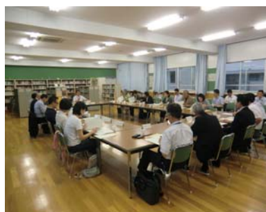
開校準備委員会の開催風景