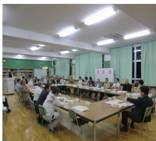
開校準備委員会の開催風景

解体工事につきまして、近隣の皆様に変化ご迷惑をおかけしております。なにとぞご理解のほど、よろしくお願いいたします。