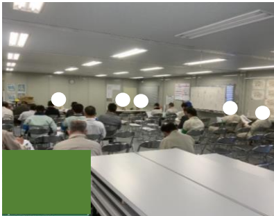
作業手順書(改訂版)