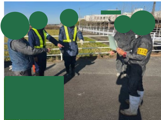
朝礼時の確認状況