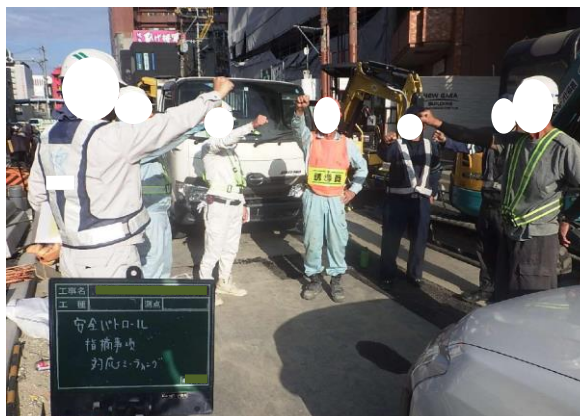
安全ミーティング