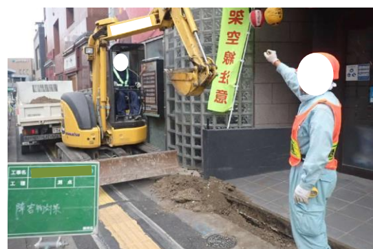
近接物の注意喚起