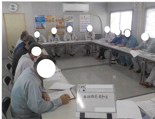
事故報告周知会の実施