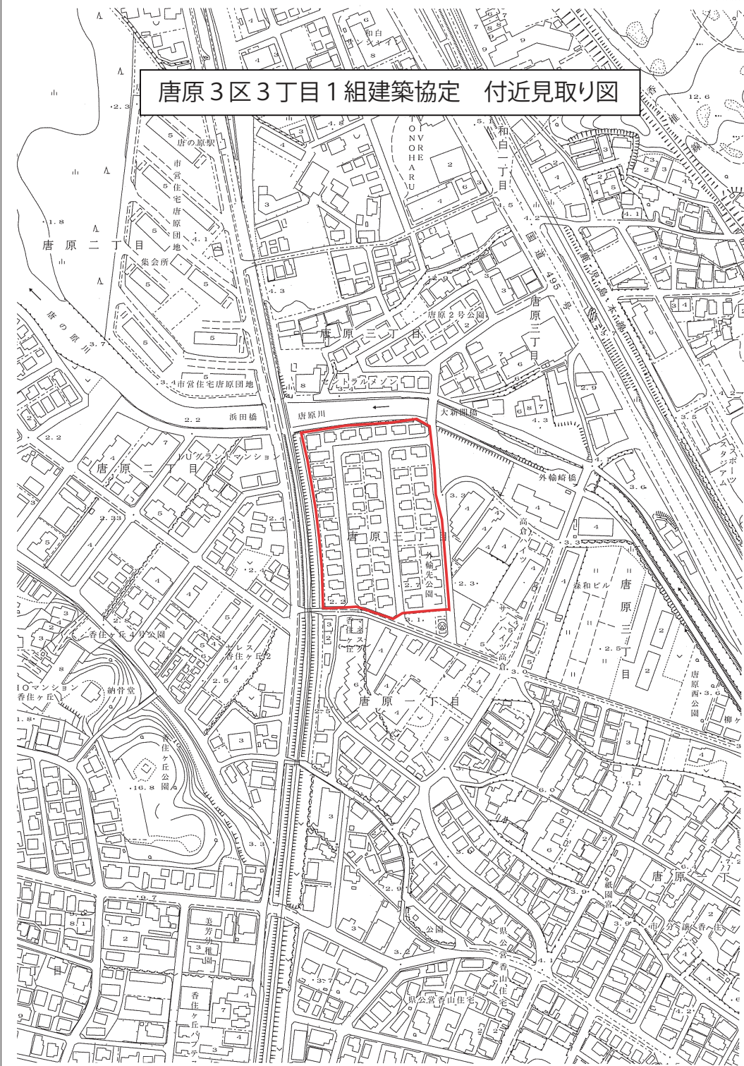
唐原3区3丁目1組建築協定 付近見取り図